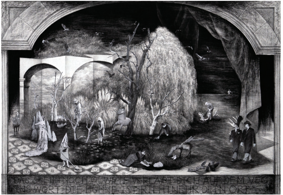
<녹투라마: 발렌틴의 도끼 #2>, 2024, 천 위에 콜라주, 연필, 목탄, 석채, 112x162cm.