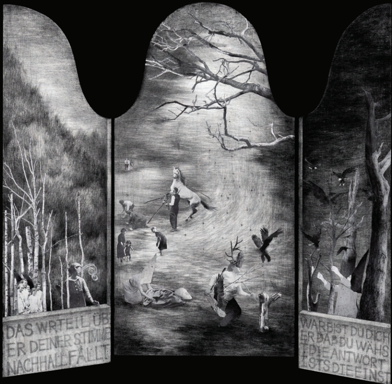
<녹투라마: 발렌틴의 도끼 #1>, 2024, 천 위에 콜라주, 연필, 목탄, 석채, 112×112cm.