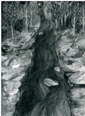
살갗의 사건_29×21cm_종이에 연필_2016 Skin to Skin_29×21cm_pencil on paper_2016