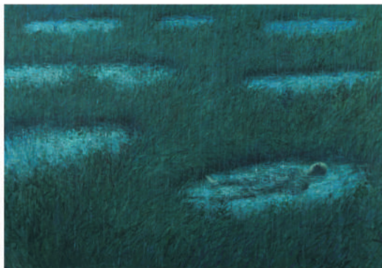
뉴_8분 18초_78컷으로 구성된 애니메이션 영상_2016 Swamp_8min 18sec_animation video of 78 pieces_2016

정석희는 서양화를 전공했고, 뉴욕 공대 대학원에서 커뮤니케이션 아트를 전공했다. 2016년 <시간의 깊이> (OCI 미술관, 서울)를 포함하여 13회의 개인전을 개최하였고, 2015년 <무심> (소마드로잉센터, 서울) 등 60여 회의 단체전에 참여하였다.