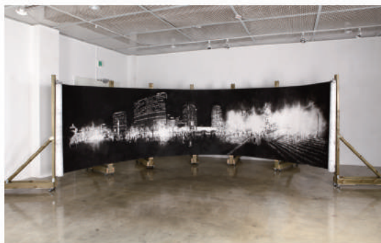
아치형태의 드로잉_150×600cm_켄트지에 콩테_2016 Drawing Arch_150×600cm_conte on kentpaper_2016

황경현은 목원대학교 미술대학을 졸업한 후, <Drawing Room>(경기도미술관, 2017), <Drawing Dome>(스페이스아도, 2016), <시대역마>(KSD갤러리, 2016), <흑백공간>(대안공간 눈, 2015), <흑백군중>(갤러리 1898, 2015) 등의 개인전을 비롯하여, <뉴드로잉 프로젝트>(양주시립장욱진미술관, 2017), <보물섬>(경기창작센터, 2016), <감각적현실>(시민청갤러리, 2016) 등 다수의 그룹전에 참여하였다. 작가의 서사적 구조 안에서 시도되는 다양한 매체의 드로잉들이 그의 주 작업을 이룬다.