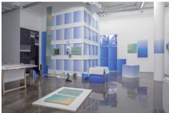
면대면 1_59.4×84.1cm, 42×59.4cm, 29.7×42cm, 총 6종, 가변크기_피그먼트 프린트_2015 Face to Face 1_59.4×84.1cm, 42×59.4cm, 29.7×42cm, six in total, dimensions variable_pigment print_2015

곽이브는 평소 우리가 살아가는 물리적 환경과 삶의 구축성에 대해 관심을 가져왔다. 주로 건물 형태에서 오는 부동성과 건축적 활동을 관찰해왔으며, 생김을 스케치하고 행위의 가변성을 이야기할 수 있도록, 평면이면서 입체가 되고, 입체이면서 평면이 되는 매체들(페인팅, 조각, 책, 인쇄물)을 다루고 있다.