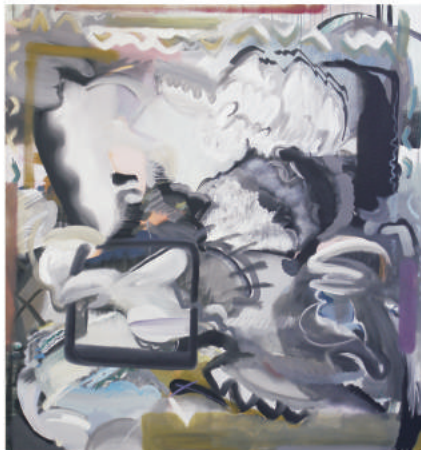
너의 특별한 하루_130×140cm_캔버스에 유화와 아크릴_2016 Your Special Day_130×140cm_acrylic and oil on canvas_2016

안상훈은 서른 나이에 낯선 독일로 떠나 10년 넘는 시간을 지내고 2017년, 오히려 낯설어진 한국 땅에서 또 다른 시작을 준비한다. 작가는 자신에게 회화란 무엇인가에 대한 질문을 꾸준히 하고 있지만 그렇다고 어떤 정해진 해답을 기대하지는 않는다.