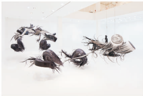
시간을 머금은 드로잉 - 드로리언_1000×500×500cm 이내 가변설치_PVC, 레진, 철, 디지털 프린트_2015 DRAWING WHICH HOLDS TIME - De Lorean_dimensions variable within 1000×500×500cm_PVC, resin, steel, digital print_2015

사진으로 치환된 결과물들의 다수는 오히려 실제와 기억의 경계를 흐릿하게 한다. 그리고 이러한 경계에 대한 고민들은 보이지 않는 차이에 대한 물음으로 이어진다. 강주현은 일련의 사진작업들을 통해 사진과 조각과 드로잉의 경계를 넘나들면서 사진조각과 사진드로잉의 형식적 가능성을 실험한다. 제한된 프레임 안에서의 재현적 사진을 입체로 구현해 사진조각을, 사진을 중첩된 선들의 집합으로 재구성해 사진드로잉을 실현하는 것이다. 사진을 단순히 대상을 기록하는 수단으로 여기는 것이 아니라, 사진의 여러 가지 조형적 특성을 발굴하고 실험하여 대상을 구현함으로써 우리 눈에 보이지 않는 대상과 사진이라는 매체의 미세한 차이들을 드러내고자 한다. 이런 차이는 무언가를 바라보는 우리의 시각에 대한 경계를 허물게 할 것이다. 현재 <감정의 신체>라는 프로젝트를 진행 중에 있는데, 이는 특정 대상에 작용하는 보이지 않는 차이를 투영하여 새로운 오브제들을 만들고 이에 관해 연구하는 작업이다. 인천아트플랫폼에서도 역시 경계의 위치에 존재하는 '차이'에 대한 새로운 해석을 통해 눈에 보이지 않는 것들을 시각적으로 표현하는 실험을 이어 나갈 예정이다. 단순히 보고 느끼는 이미지만이 아니라, 시간과 공간, 상상력이라는 요소들을 이용하여 새롭게 조합되거나 상상 속에서 만들어지는 대상으로서의 이미지로, 이미지의 개념을 새롭게 확장할 수 있도록 연구하는 것이다.