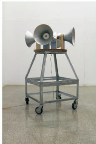
안정적 불안정 - 고립주의의 환상 속에서_60×60×135cm_아연도금강철, 알루미늄, 목재, 음향_2016 Stable instability - Under the illusion of Isolationism _ 60×60×135cm_zinc galvanized steel, aluminum, wood, sound_2016

1972년 서울에서 출생한 심승욱은 홍익대학교와 시카고 아트 인스티튜트 스쿨에서 조각을 전공하였다. 지금까지 10여 회의 개인전과 여러 기획전에 참여해왔다. 작가는 조각, 설치, 사진 등 다양한 시각매체를 통해 인간 욕구의 결핍과 과잉 속에서 경험되는 사회 현상에 주목한다. 표면적 안정 속에 비가시적으로 잠재해 있는 불안정, 타인에 대한 배타적 태도와 자기 보호 차원에서의 고립주의의 문제 등 시의성 있는 여러 가지 내용들을 재해석하여 작품으로 표현해 오고 있다.