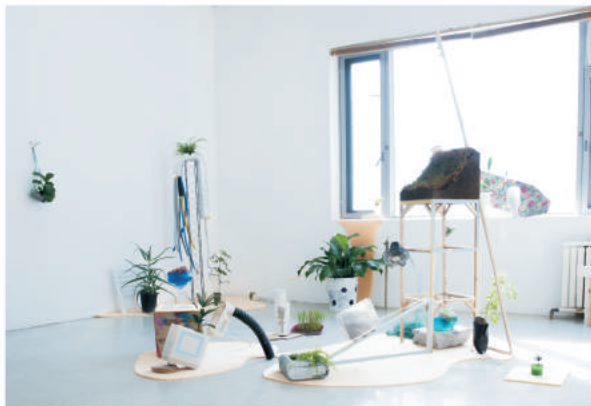
재활용조경_가변크기_생물 오브제, 식물, 테이프, 나무_2016 Recycled Gardening_dimensions variable_life objects, plants, tape, tree_2016