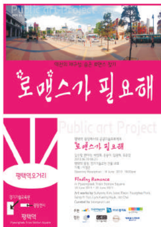
공공미술프로젝트_《로맨스가 필요해》_2013 Public art project_Finding Romance_2013