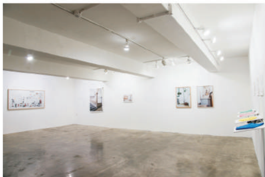
전시 《비인칭적 삶》_2016 Exhibition Impersonal Life_2016

floatingclouds.press@gmail.com http://floatingcloudspress.tistory.com