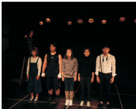
창조경제_연극_2015 Creative Economy_theater_2015