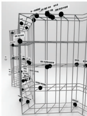
지도바깥_가변크기_3D모델링_2017 Off the Map_dimensions variable_3D modeling_2017