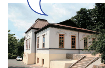
〈제물포 구락부(시 유형문화재 제 17호)〉

중구, 해안동, 신포동 일대는 현재까지 수많은 근대 문물의 역사와 함께 호흡하고 있습니다.