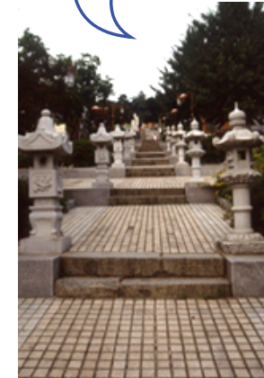
〈청, 일 조계지 경계 계단(시 기념물 제 51호)〉

개항을 통해 인천으로 서구 문물이 유입되었으며, 현재의 인천아트플랫폼 일대에 일본, 청국, 각국조계지가 조성되었습니다.