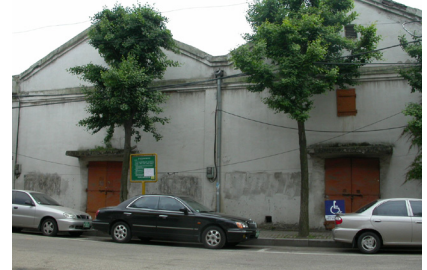
〈B동〉 창고(1948년) ⇒ ( )