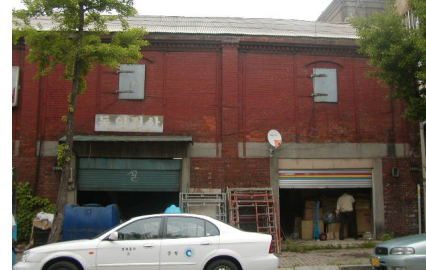
〈A동〉 인쇄소(1902년) ⇒ ( )