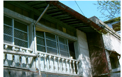
〈H동〉 점포형 주택(1943년) ⇒ ( )

〉〉 인천아트플랫폼은 폐허처럼 남겨지거나 철거될 수 있었던 잉여 공간에 문화예술을 적용해 구도심의 부활과 동시에 인천의 역사성을 이어나가고 있습니다. 과거뿐만 아니라 현재를 살아가는 사람들의 이야기가 역사 위에 계속 이어지고 있습니다.