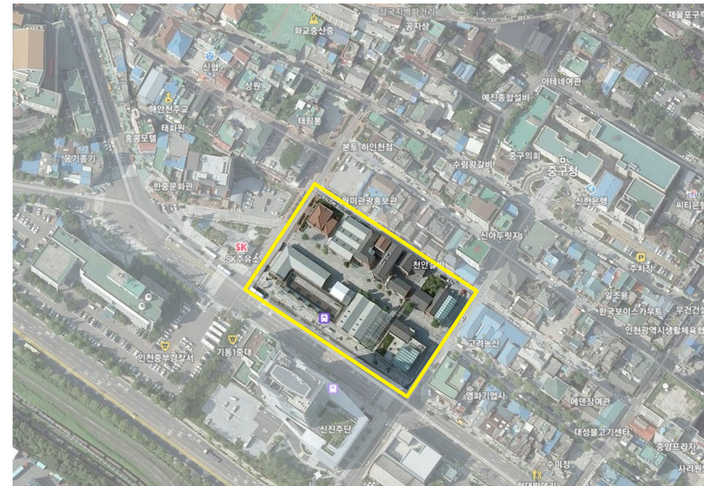
〈인천광역시 중구 해안동 일대 지도〉