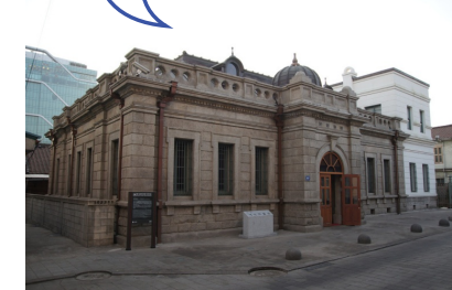
〈인천개항박물관(시 유형문화재 제 7호)〉

인천은 개항장으로써 다양한 서구의 건축물과 대한민국 최초의 근대문화유산이 조성되어 있습니다.