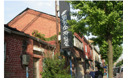
〈E동〉 피카소작업실(1933년) ⇒ ( )