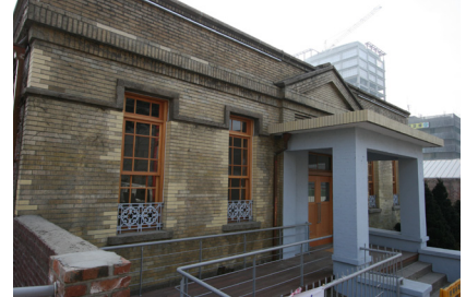
〈D동〉 회사(1888년) ⇒ ( )