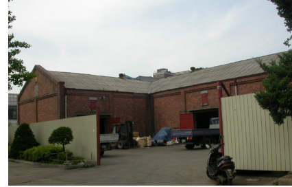
〈C동〉 창고(1948년) ⇒ ( )